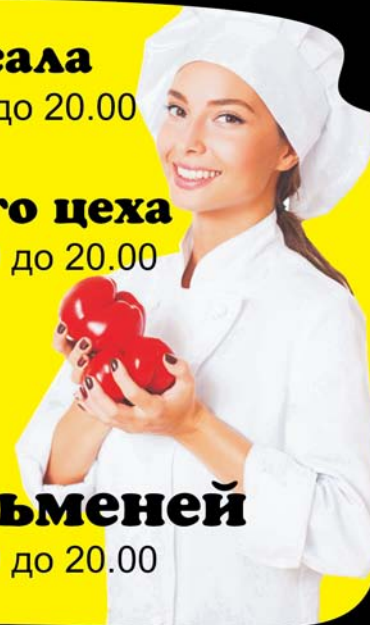
График работы - 3/3 с 08.00 до 20.00 З/п - 15 000 руб.