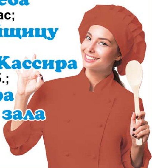
График работы 3/3, официальное трудоустройство. Район работы - ул. Чернышевского.