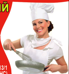
График работы 5/2, с 7:00 до 16:00 ч. Наличие сан. книжки, компенсация питания. Место работы: г. Уфа, ул. 50 лет Октября, 13/1 (ост. Дом Печати, здание ФНС). Тел.: 8-917-42-36-573, e-mail: del_72@mail.ru

Кондитерский цех УфаДесерт приглашает на работу: