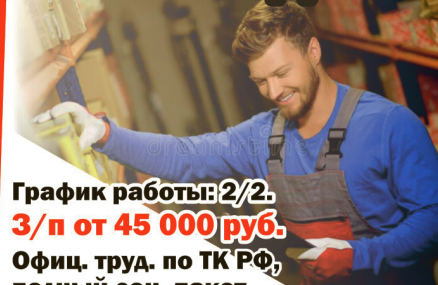
График работы: 2/2.